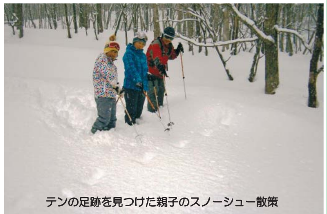
テンの足跡を見つけた親子のスノーシュー散策